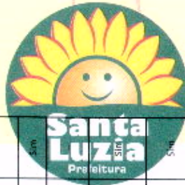
ANEXO VII - TABELA DE INFRAÇÕES E PENALIDADES CARÍVEIS